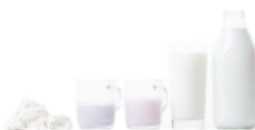
MLÉČNÉ PRODUKTY Z FAREM